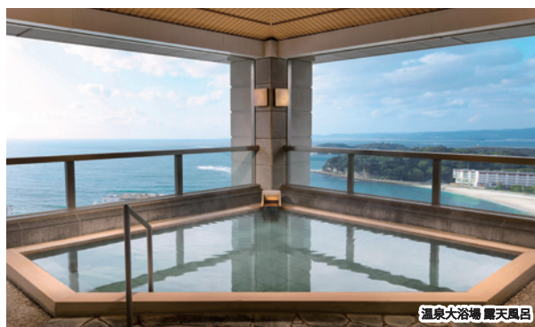
温泉大浴場 露天風呂